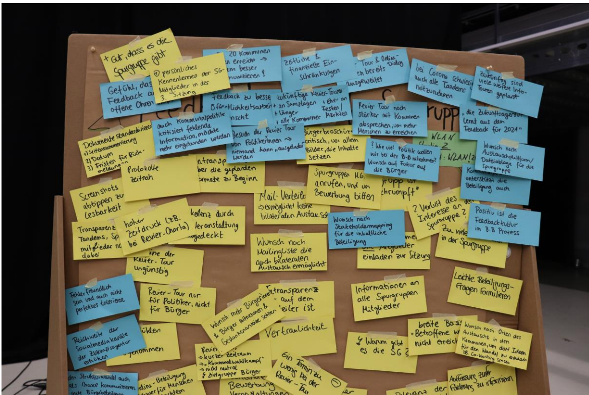
Abbildung 1: Foto der Pinnwand mit Feedback zum Beteiligungsprozess

Nachfolgend wurde der Raum für Rückmeldungen aus der Spurguppe zur bisherigen Zusammenarbeit und dem Beteiligungsprozess eröffnet. Dr. Oliver Märker moderierte die Diskussion. Alle Rückmeldungen wurden auf Moderationskarten festgehalten und sichtbar auf eine Pinnwand angebracht (siehe Abbildung 1).